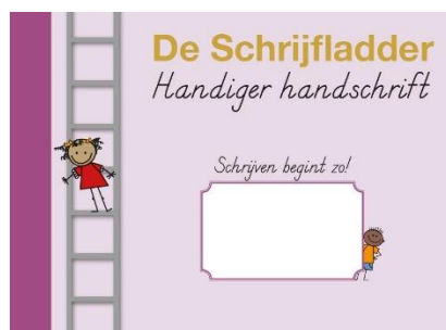
Scheurblok 'Schrijven begint zo!'