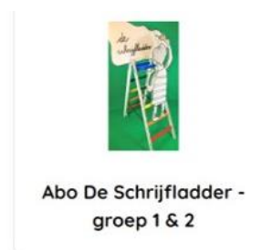
Abo De Schrijf ladder - groep 1 & 2