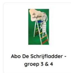
Abo De Schrijf ladder - groep 3 & 4