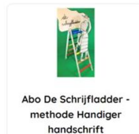
Abo De Schrijf ladder - methode Handiger handschrift